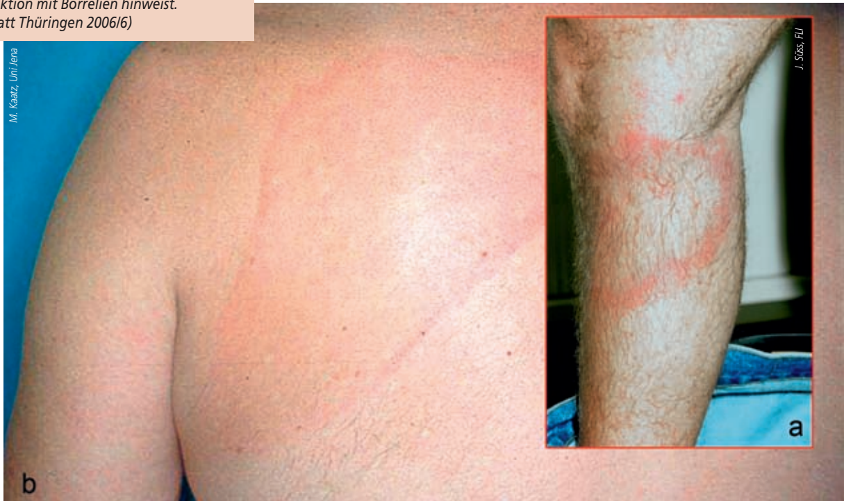
Abb. 3: Ringförmige Hautrötung um einen Zeckenstich, die auf eine Infektion mit Borrelien hinweist.

Mittelwert liegt bei 15–20 %, kann aber in manchen Zeckenpopulationen auch über 50 % erreichen. Im Gegensatz zur regional begrenzt vorkommenden FSME ist die Borreliose überall, wo Ixodes ricinus auftritt, verbreitet.