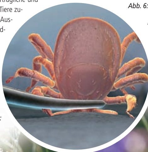
Abb. 6: Fachgerechtes Entfernen einer angesogenen Zecke: Man fasst die Zecke so hautnah wie möglich mit einer gut schließenden Stahlpinzette und zieht sie aus dem Stichkanal heraus. Dabei ist das Drehen nach links oder rechts nicht nötig. ( www.zecken.de )

Abb. 5: „Blumenwiese“, ein typisches Zeckenbiotop: Je artenreicher eine solche Wiese ist, umso mehr Samen verschiedener Gräser werden produziert. Diese bilden eine Nahrungsquelle für Mäuse, die die Zecken „mitbringen“